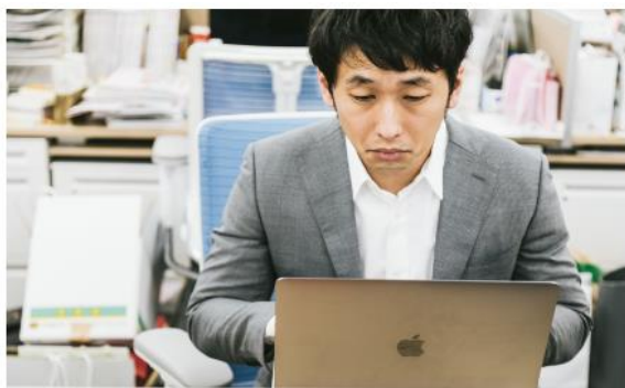
「静かな退職」は経営課題（写真はイメージ）

クアルトリクス合同会社の調査によると、日本で働く人の約15%が該当することがわかりました。40代・50代の中堅・シニアクラス、周囲との連携が弱い人、パフォーマンスが平均に満たない人などに、その傾向がみられるといます。会社への不満が募ってモチベーションが下がったり、従業員がもともとそうした考えを持っていたりしていることが原因として考えられます。